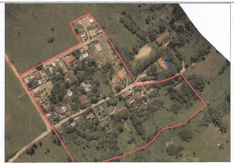
FOTO AÉREA DO LOTEAMENTO